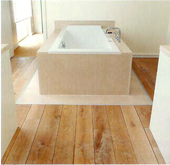
Stilistisch eine Augenweide ist die Kombination der Eichendielen mit Sandstein im Ausstiegsbereich der Badewanne.